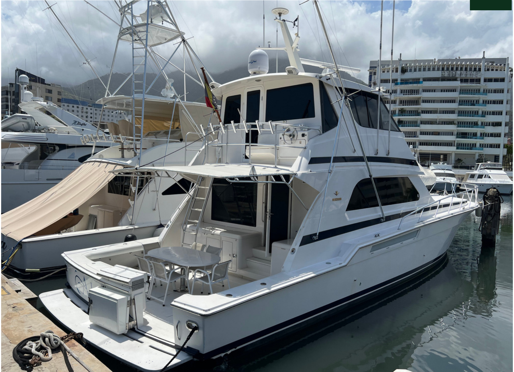
BERTRAM 60 | 24 kn | Guest 8 | Crew 2