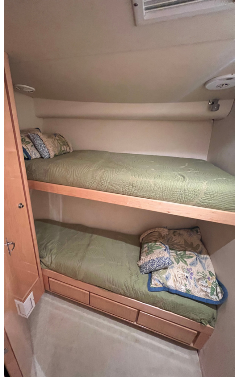
TERCER Y CUARTO CAMAROTE