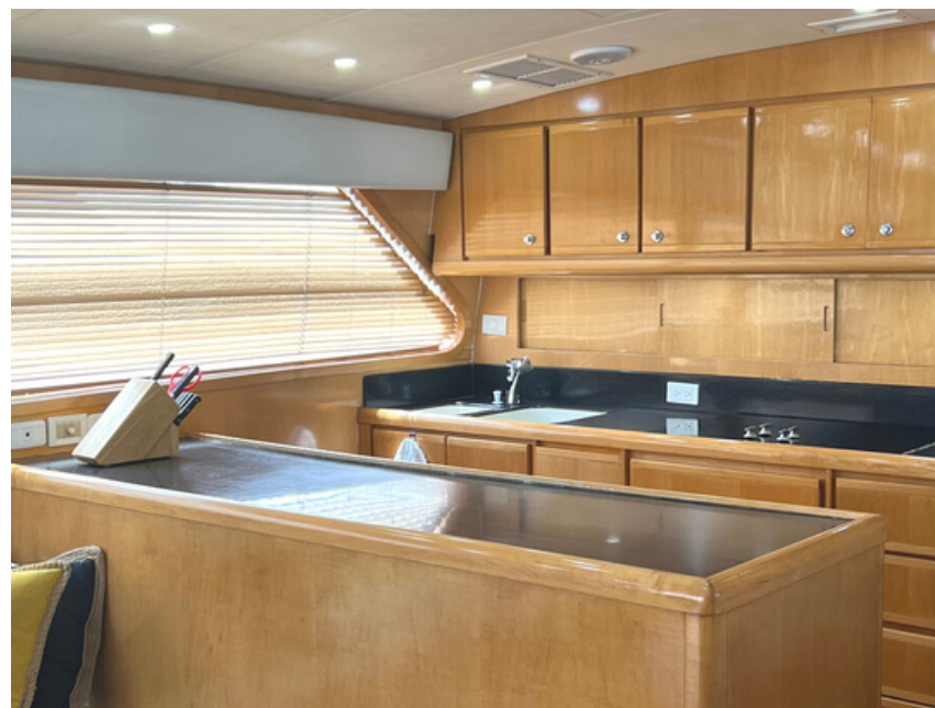
COCINA Y COMEDOR