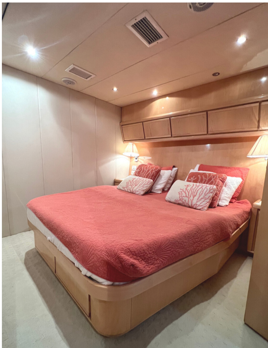
BERTRAM 60 | 24 kn | Guest 8 | Crew 2