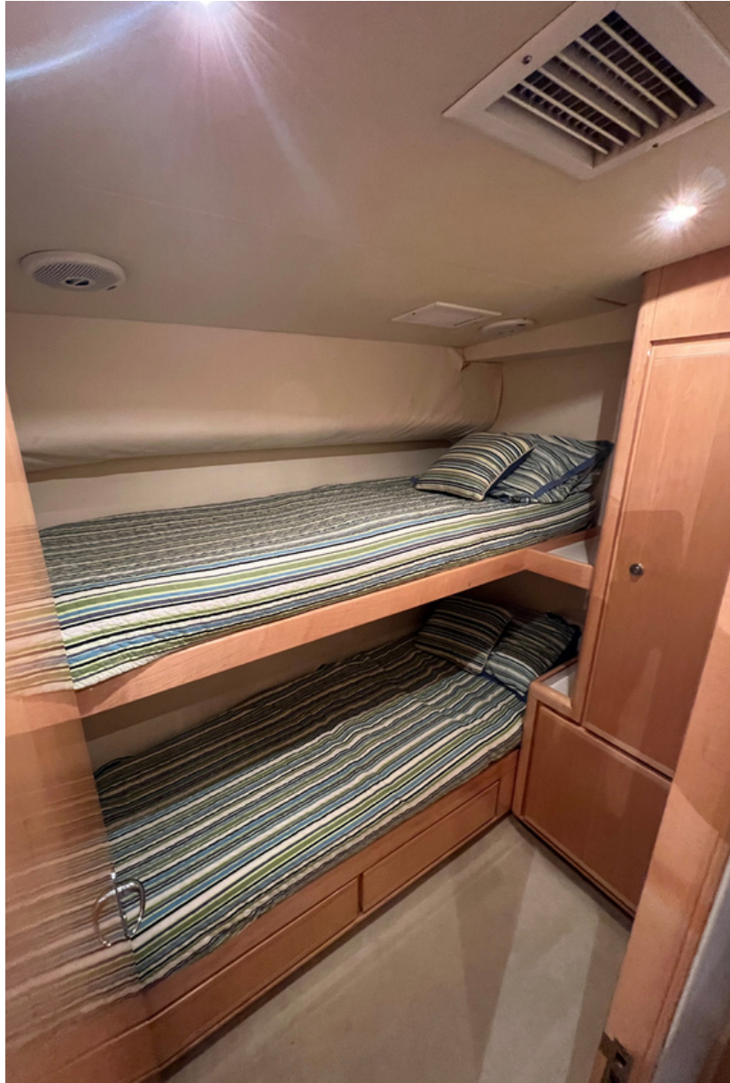
BERTRAM 60 | 24 kn | Guest 8 | Crew 2