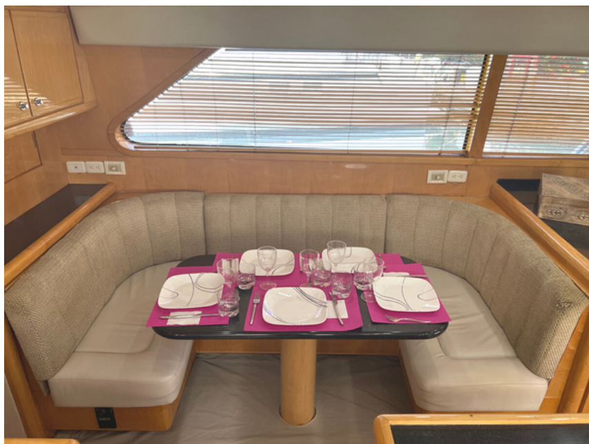
BERTRAM 60 | 24 kn | Guest 8 | Crew 2