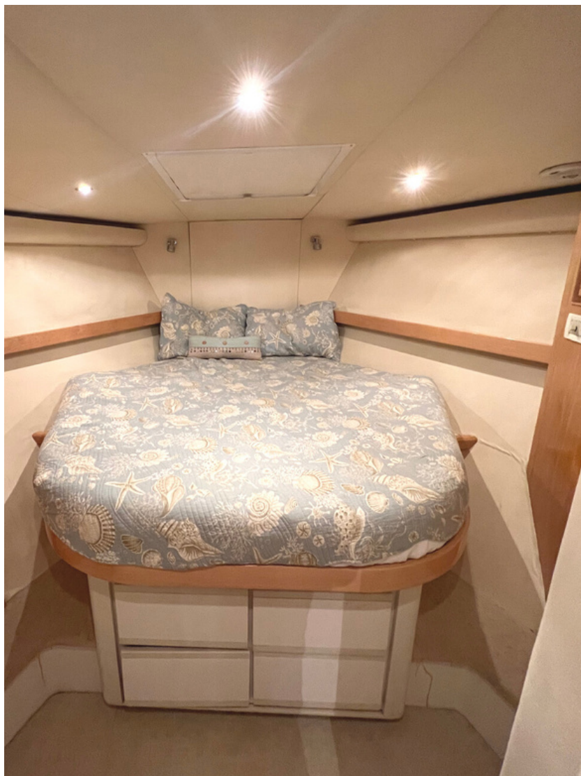
BERTRAM 60 | 24 kn | Guest 8 | Crew 2